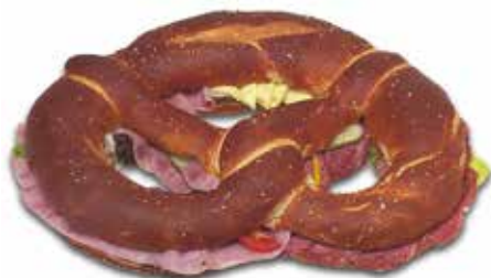
Reichhaltig gefüllter Laugenbrezel mit feinem Ländle Schinken, würziger Haussalami und mildem Käse belegt und garniert