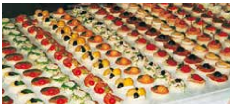
Canapés ein Augen- und Gaumenschmaus