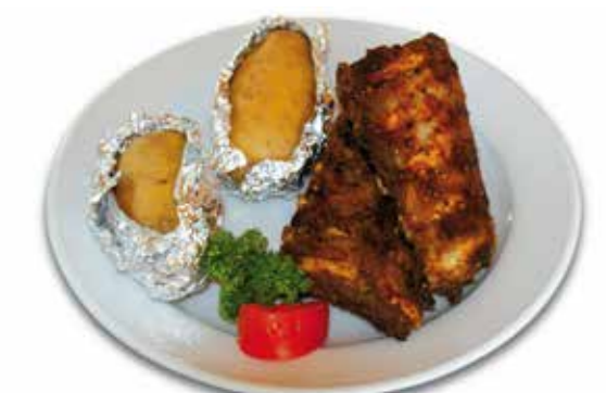
Spareribs 7 mit Folienkartoffel und Sauerrahm-Dip