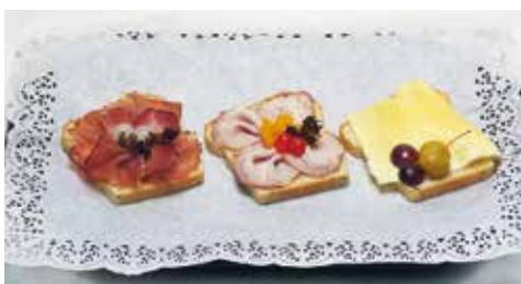
Wurzelbrot in Scheiben ganz nach ihrem Wunsch belegt