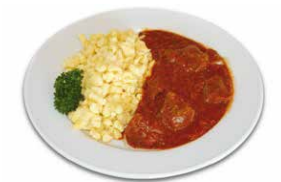
Rindergulasch 1/7/9 mit Spätzle