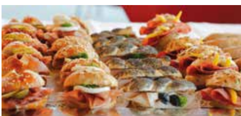
Schurgebäck / Partybrötle vom Mohnsemmel bis zum Laugenweckerl - reichhaltig belegt