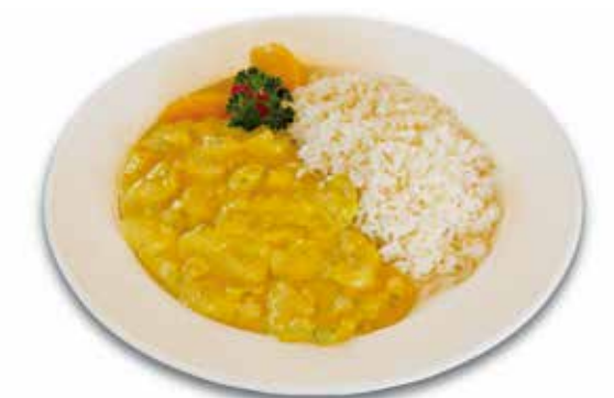
Curry-Geschnetzeltes 1/6/7/9 mit Reis