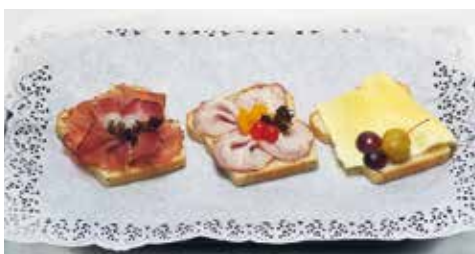
Wurzelbrot in Scheiben ganz nach ihrem Wunsch belegt